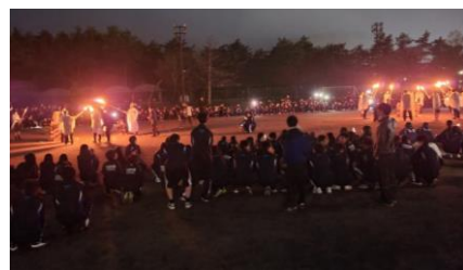
キャンプファイヤーの様子

2024年4月22日(月)、中高の新入生684名は「富士緑の休暇村」(山梨県南都留郡鳴沢村)で2泊3日の宿泊合宿を行いました。これまでは中学1年生だけで行っていたHR合宿ですが、今年度からは高校1年生も一緒に実施することになりました。新しい東洋大牛久の、新しい行事です。実にバス18台での大移動! 現地では中学校、高校各コースで異なるプログラムを実施しました。天候にはあまり恵まれませんでした、生徒たちは十分に楽しんでいました。生徒たちの活動の様子をお伝えいたします。